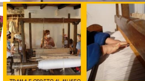
TRAMA E ORDITO AL MUSEO