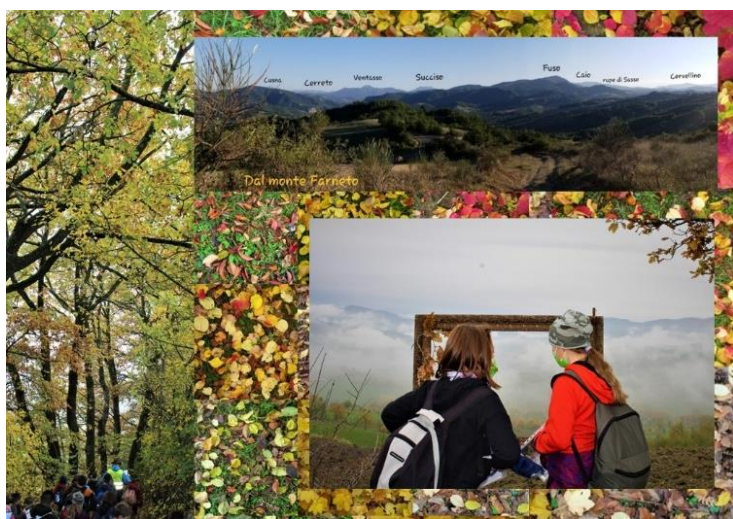
Per guardare una parte di paesaggio....