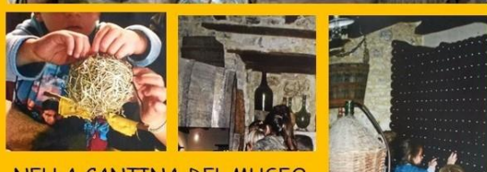
NELLA CANTINA DEL MUSEO