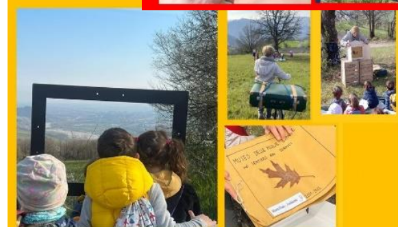
Kamishibai alla grande quercia