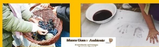
Museo Uomo Ambiente Il territorio nel tempo Bazzano (Parma)